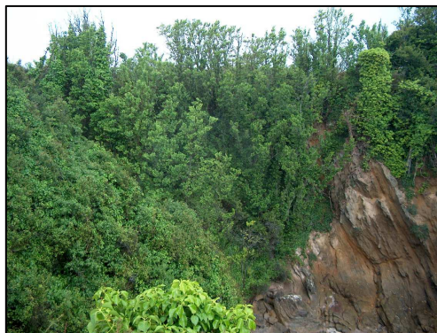
Figure 14 - Les ormaies littorales sur pans de falaises (Port Lay).